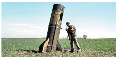
آیا جنگ جهانی سوم آغاز شده است؟