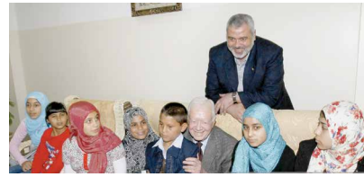
گزارش بی‌واسطه از فلسطین