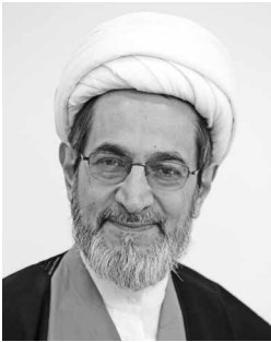
محمد مسجد جامعی